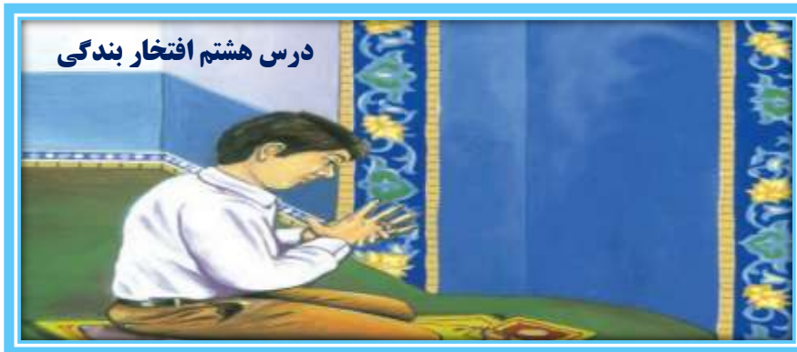
درس هشتم افتخار بندگی

پسرم ، این هدیه را از من و مادرت بپذیر . هدیه ای برای تبریک امروز . امروز روز مهمی برای توست ؛ تو از امروز به سن تکلیف می رسی . اگر به سال شمسی حساب کنی ، چند ماه مانده است ، ولی سن تکلیف را به سال قمری حساب می کنند . تو امروز وارد مرحله جدیدی از زندگی ات می شوی ؛ دورانی که در آن مسئولیت های جدیدی بر عهده می گیری . با خود گفتم : درست است . از امروز باید این افتخار بزرگ را قدر بدانم و از این پس نماز هایم را به موقع به جا بیاورم . از امروز خداوند مرا به صورت رسمی در جمع بندگانش پذیرفته است . و چه احساس خوشایندی .